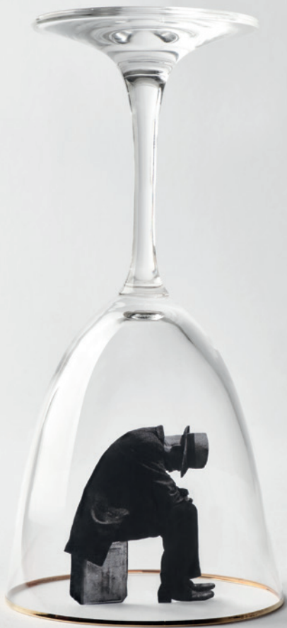
Imagen de La leyenda del santo bebedor de Joseph Roth / Diseño Estrada